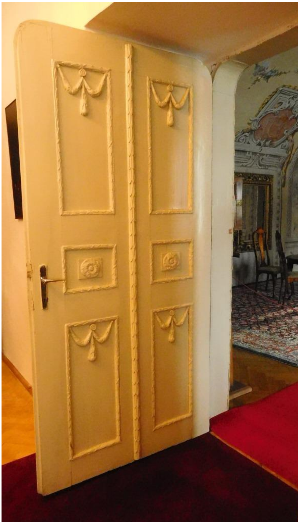
Dvere s obojstrannou výzdobou - súčasný stav