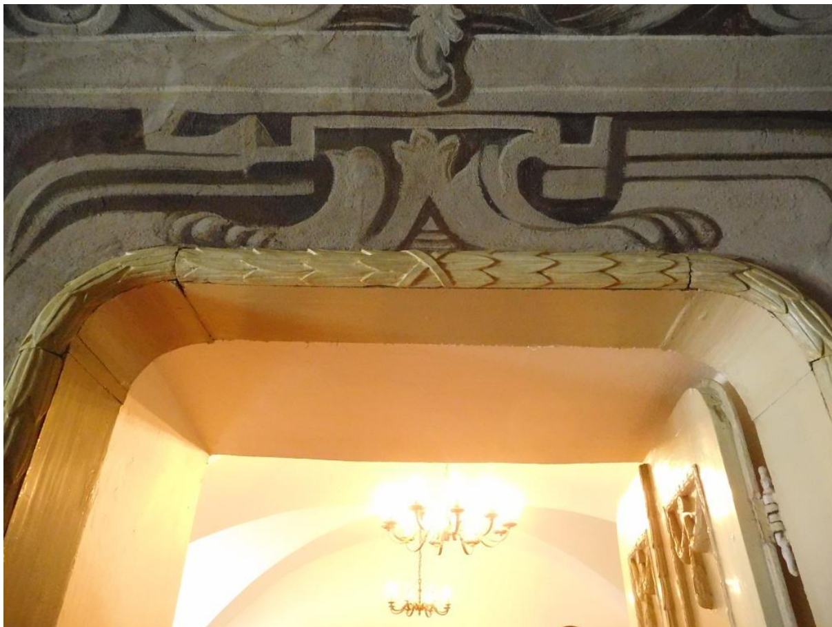
Detail hornej časti zárubne