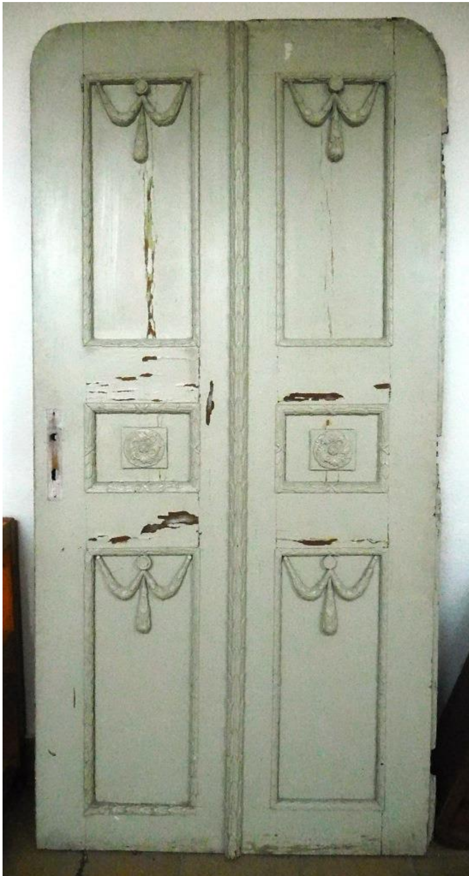
Dvere s výzdobou na jednej strane - súčasný stav