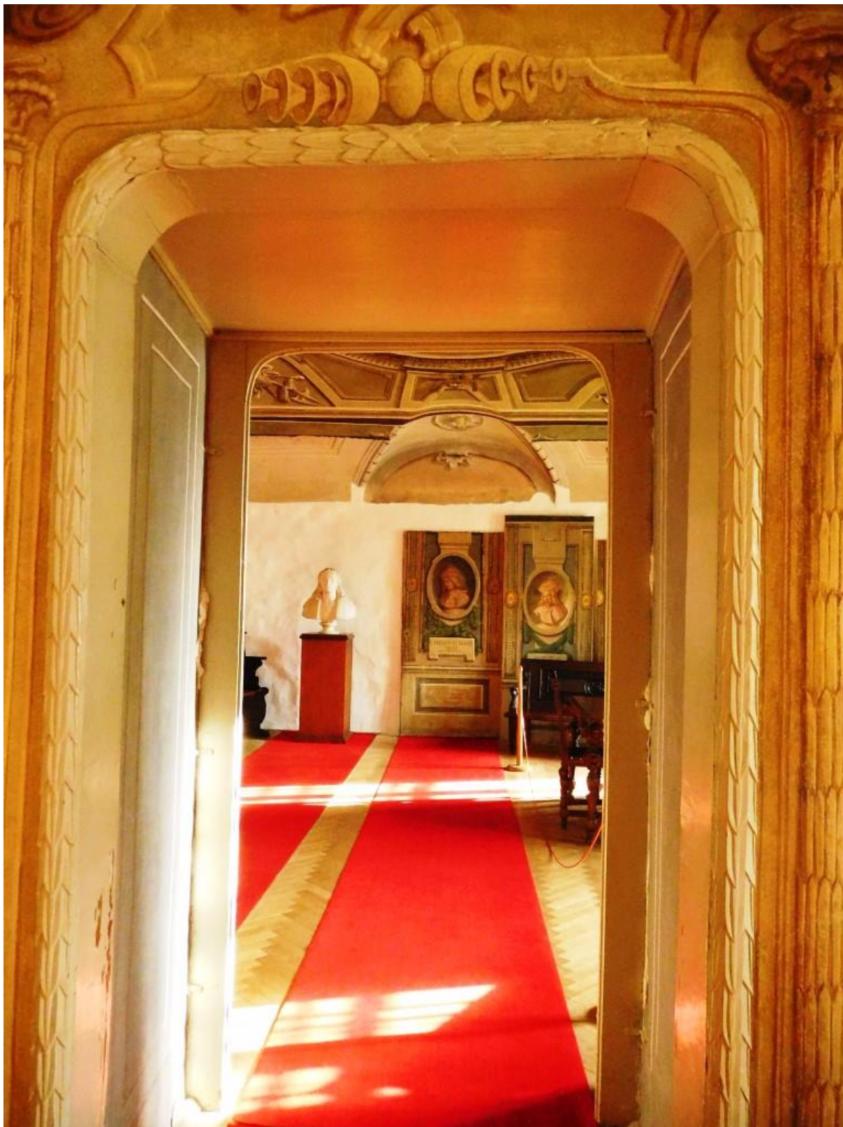
Zdobená zárubňa a dvere do izby uhorských kráľov - súčasný stav.