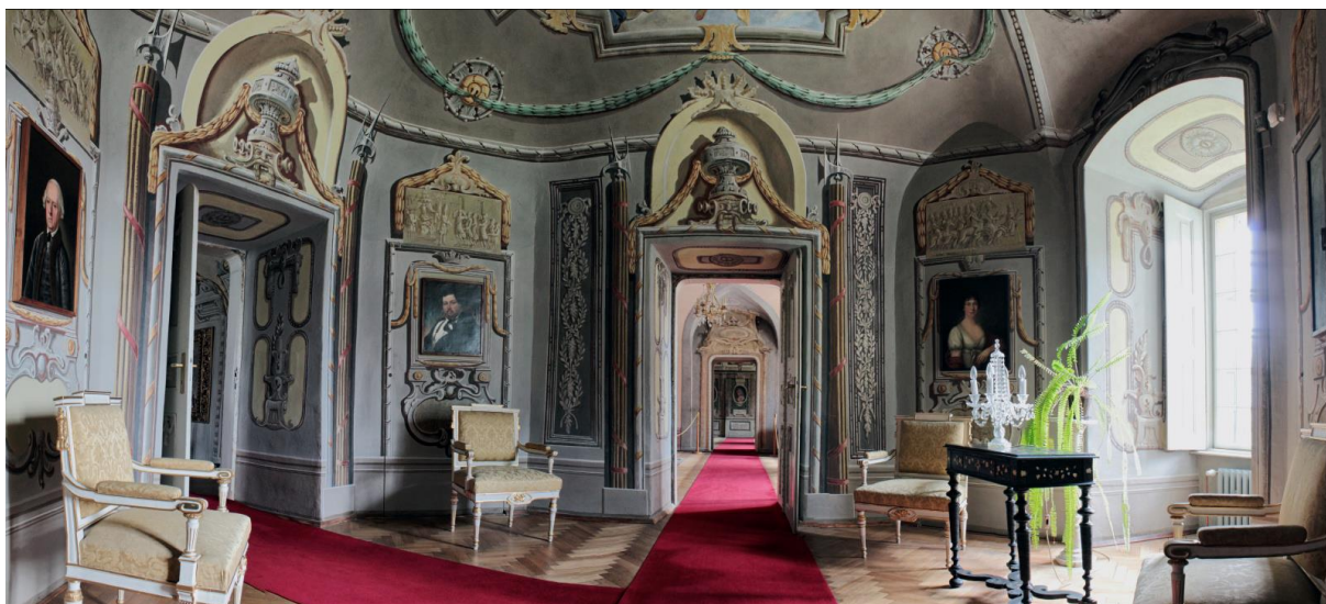
Pohľad na časť komplexu miestností s iluzívnymi maľbami v interiéroch kaštieľa v Humennom.