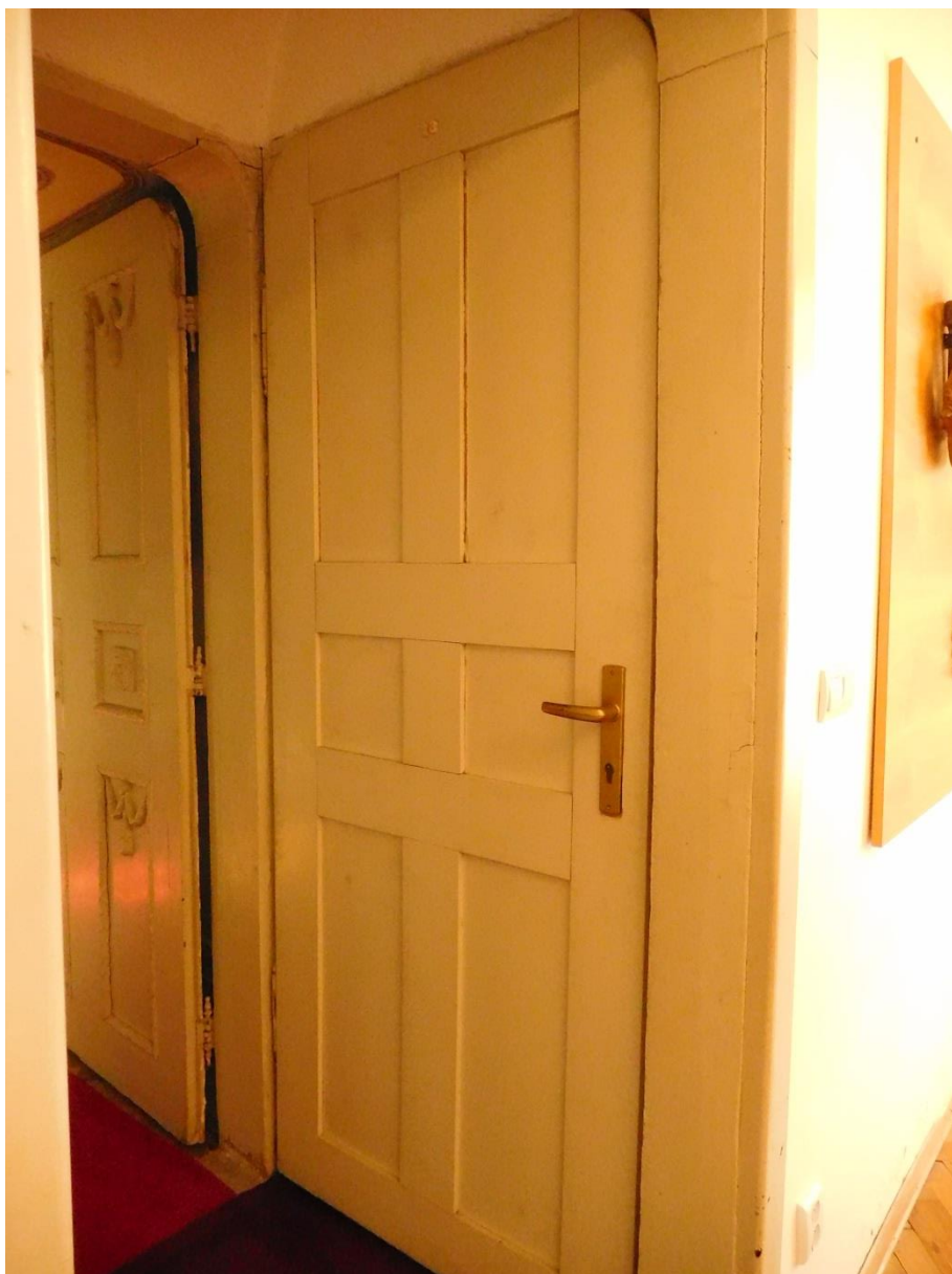
Sústava dverí bez výzdoby a s výzdobou.