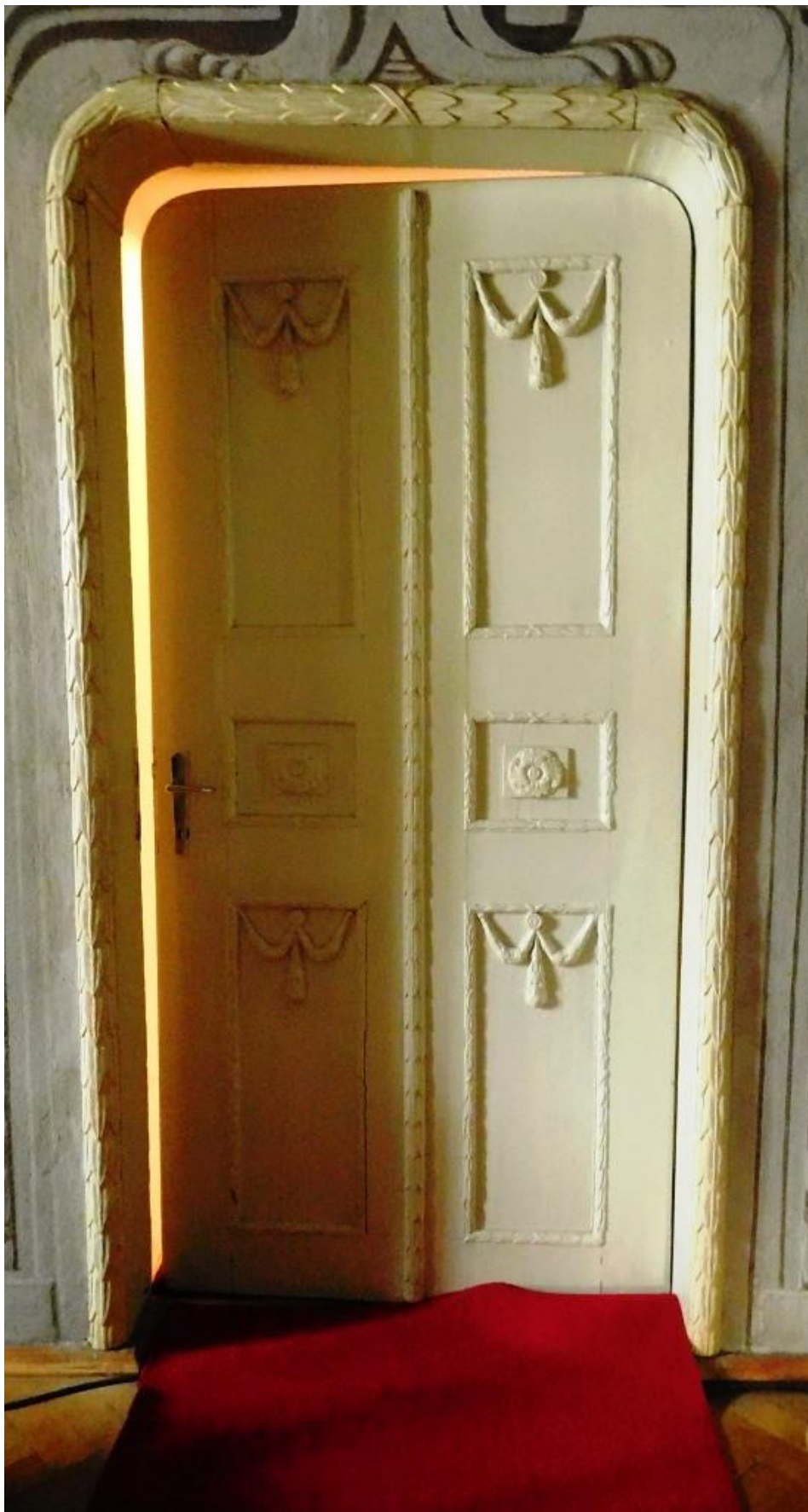
Dvere s obojstrannou výzdobou a vyrezávaná časť zárubne - súčasný stav